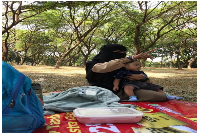
Gambar Belajar di alam melalui bahasa ibu

tua, membangun imaji yang positif terhadap alam sekitar, serunya belajar dan rasa ingin tahu yang tidak terbentur dengan adab. Dengan kegiatan ini dapat menimbulkan antusias bereksplorasi dan berimajinasi di alam sehingga anak dapat mencintai sumber ilmu.