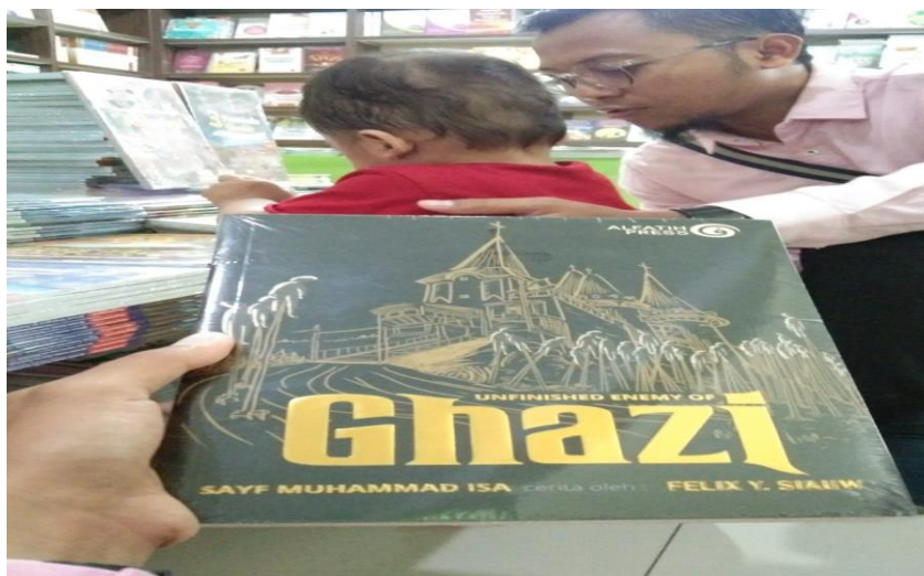
Gambar Kisah Inspiratif melalui seorang ayah