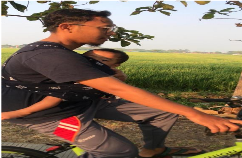
Gambar olahraga sepeda santai

Orang tua maupun pendidik sebagai design thinkers dan menjadikan pendidikan tersebut terpersonalisasi. Sehingga wujud dari pendidikan terpersonalisasi dan design thinkers salah satunya adalah buku orang tua. Buku orang tua bagi anak usia dini memiliki tahapan antara lain: 1) Memulai dengan mengetahui dimensi-dimensi buku orang tua, 2) Membuat jurnal kegiatan, 3) Dokumentasi jurnal kegiatan buku orang tua. Adapun dimensi-dimensi yang harus diperhatikan dalam pembuatan buku orang tua untuk anak usia dini menurut Santosa H. (2021: 394) sebagai berikut: