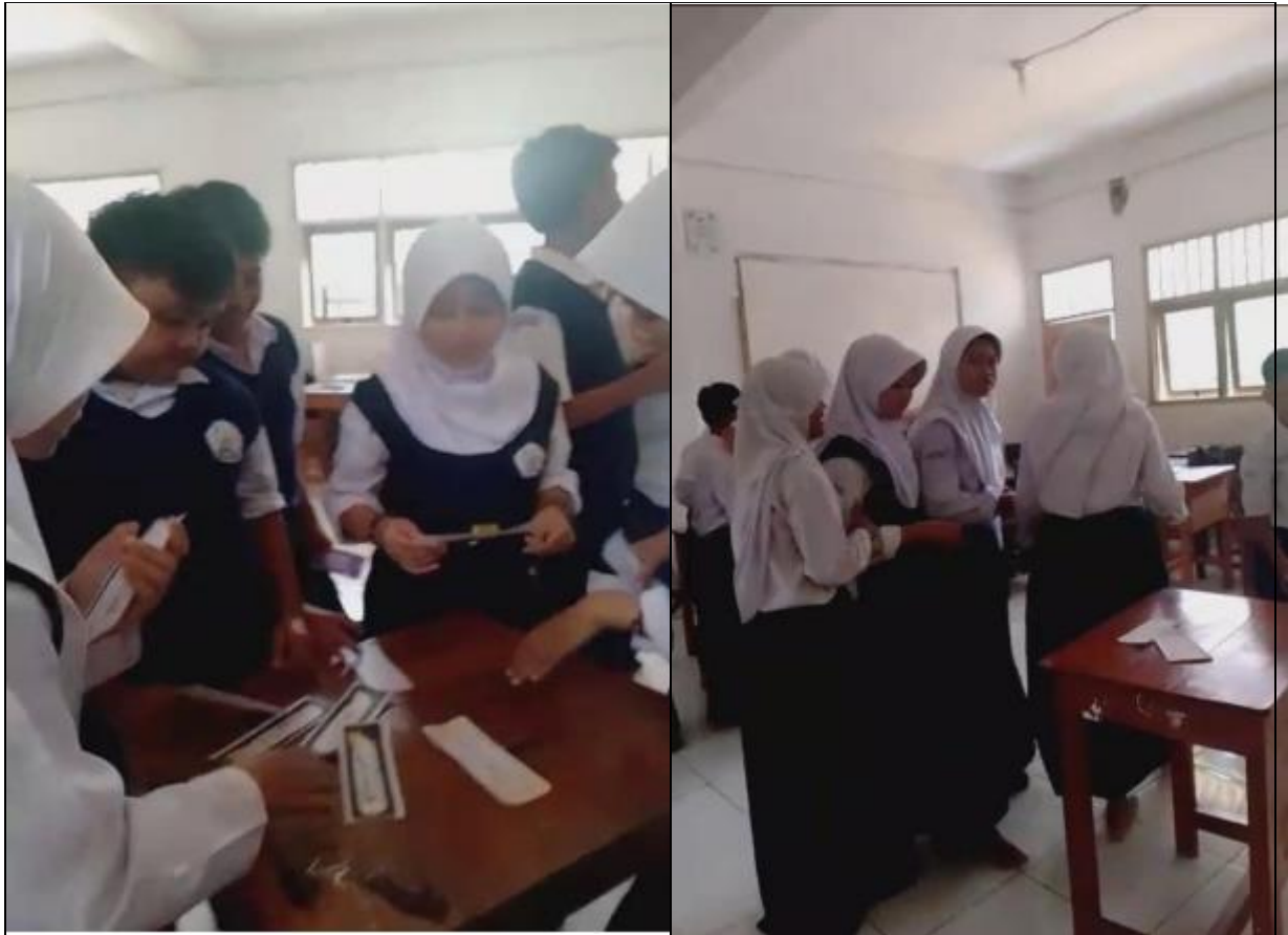
Gambar 2 Proses Pembelajaran Kitabah dengan Model Pembelajaran Go to Your Post