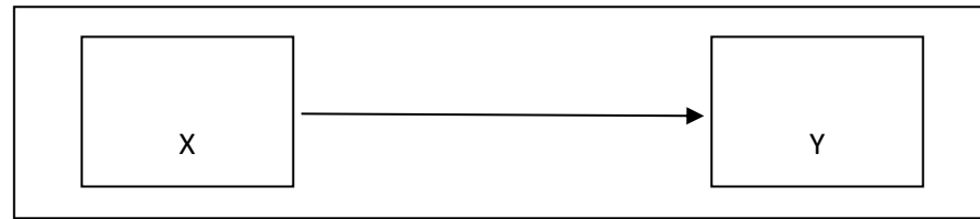
Gambar 1 Desain Penelitian Analisis Regresi Sederhana